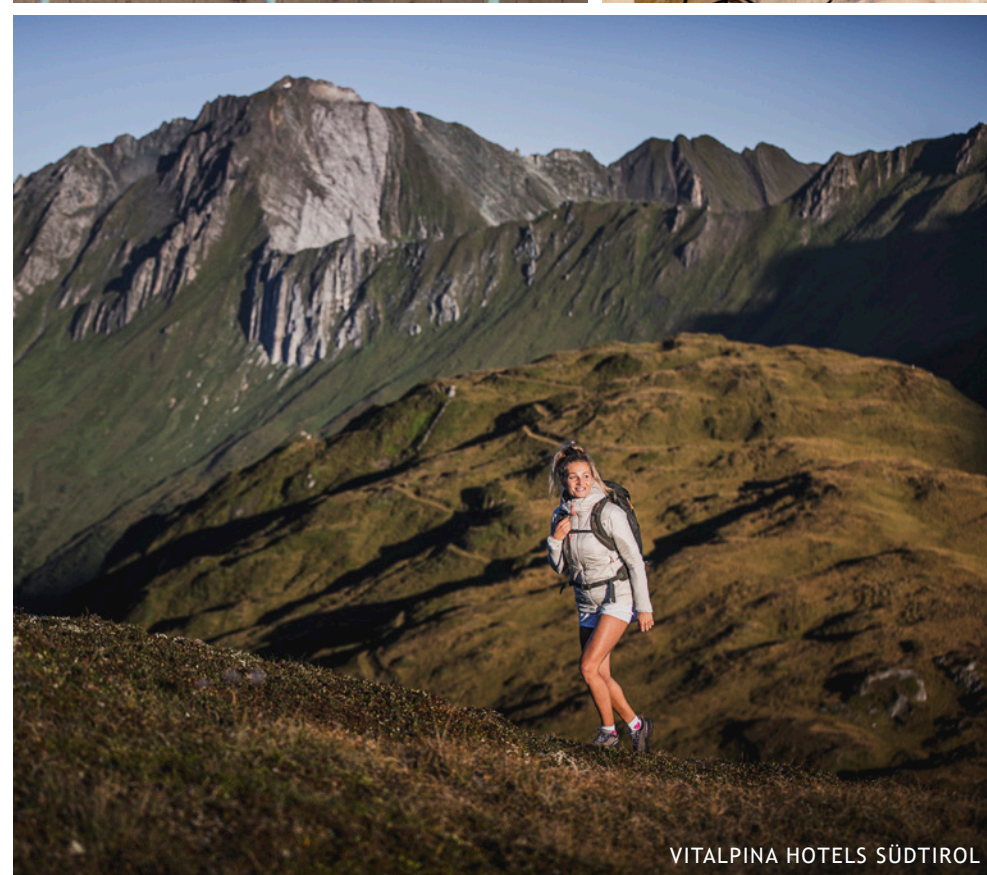
VITALPINA HOTELS SÜDTIROL