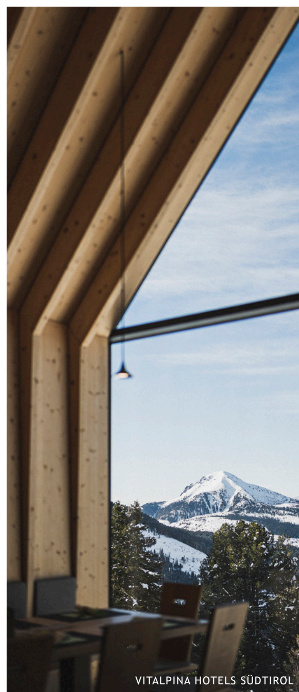
VITALPINA HOTELS SÜDTIROL