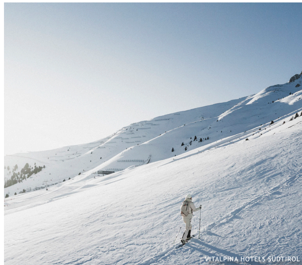
VITALPINA HOTELS SÜDTIROL