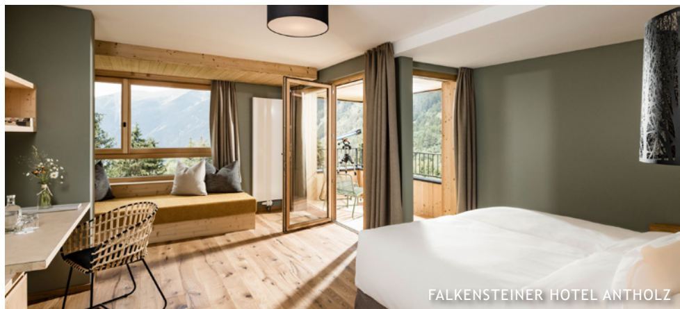
FALKENSTEINER HOTEL ANTHOLZ