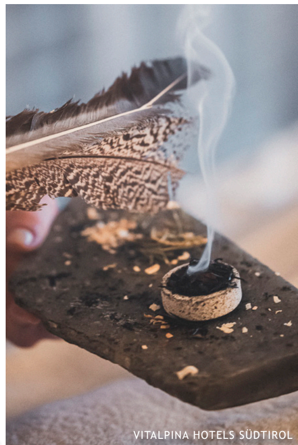
VITALPINA HOTELS SÜDTIROL