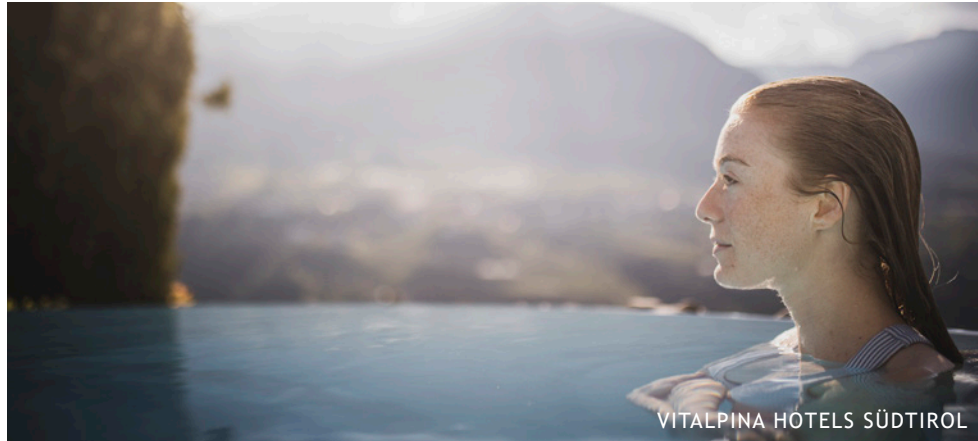
VITALPINA HOTELS SÜDTIROL