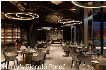
Harry's Piccolo Poreč