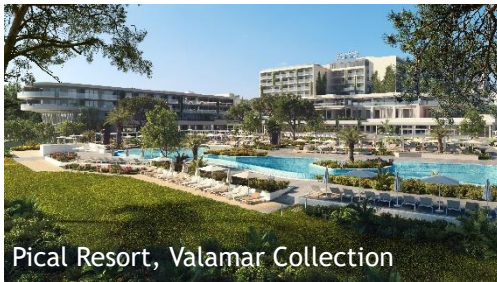
Pical Resort, Valamar Collection

Mit dem Pical Resort, Valamar Collection, eröffnet Valamar im März 2026 sein bislang größtes Einzelinvestment. Das neue Fünf-Sterne-Resort entsteht am Strandpark Parenzana, nur wenige Gehminuten von der UNESCO-geschützten Altstadt von Poreč entfernt, und vereint unterschiedliche Unterkunfts-konzepte für Paare, Familien und anspruchsvolle Individualreisende. Ergänzt wird das Angebot durch umfangreiche Spa-, Freizeit- und Aktivbereiche sowie durch eines der modernsten Kongress- und Veranstaltungszentren Istriens, wodurch sich das Pical als hochwertiger Ganzjahresstandort positioniert. Bereits Mitte Februar 2026 eröffnet Valamar das Jadran Heritage Hotel, Valamar Collection, direkt an der historischen Uferpromenade von Poreč. Das exklusive Fünf-Sterne-Boutiquehotel verfügt über nur zwölf individuell gestaltete Zimmer und Suiten und bietet ein besonders persönliches Hotelerlebnis. Inspiriert von den Goldenen Zwanzigern interpretiert das Haus die Anfänge des Tourismus in der Region neu und verbindet elegantes Design mit kunstvollen Details und maßgeschneidertem Service.