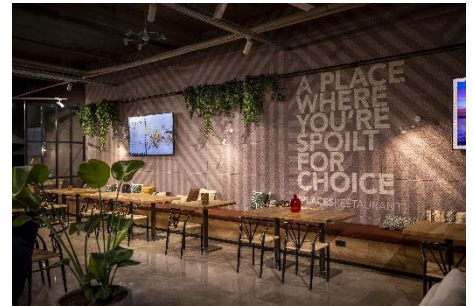
Bilder 1-7