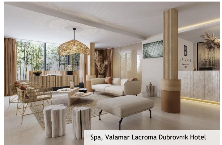
Spa, Valamar Lacroma Dubrovnik Hotel