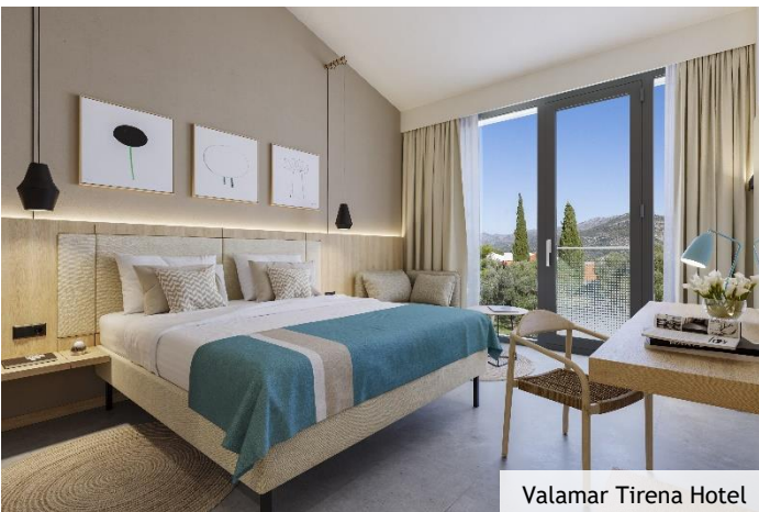
Valamar Tirena Hotel