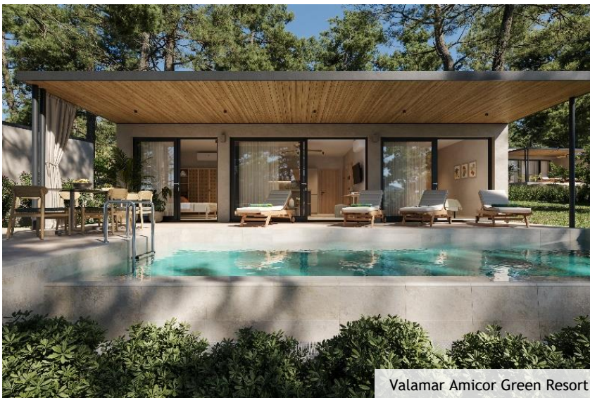
Valamar Amicor Green Resort