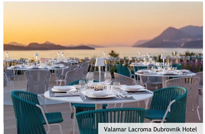
Valamar Lacroma Dubrovnik Hotel