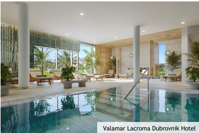
Valamar Lacroma Dubrovnik Hotel