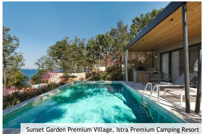
Sunset Garden Premium Village, Istra Premium Camping Resort