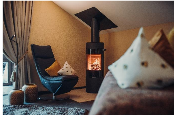
Bilder 5-6: Suite Bienenkorb