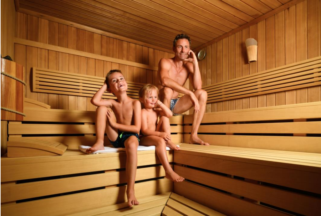
© Löwe & Bär Leading Family Hotels & Resort