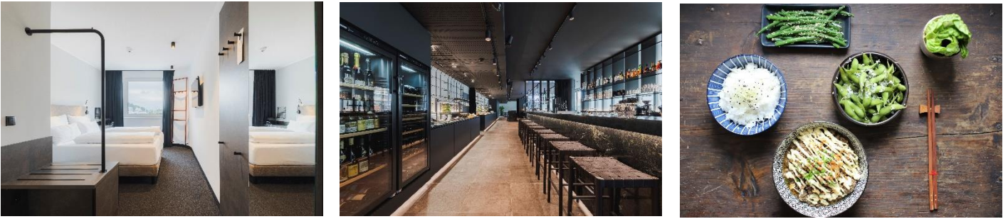
Bilder 1-3 © NIGHT INN, Bild 4 © NIGHT INN_KassianXander