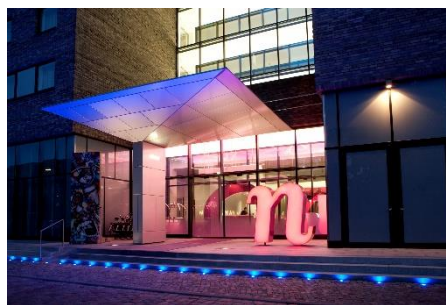
nhow Berlin, Außenansicht