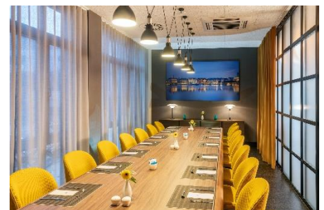
NH Hamburg Altona, Meeting Room

NH Hotel Group – Northern Europe Presseabteilung