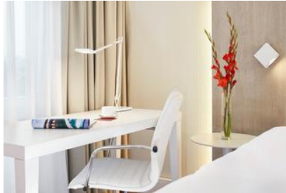
NH Collection Hamburg City