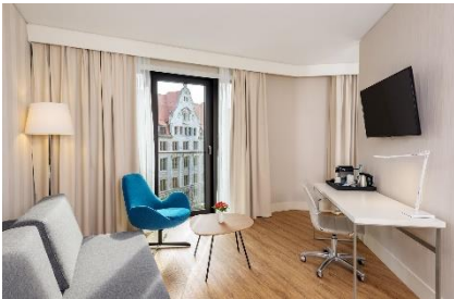
NH Leipzig Zentrum