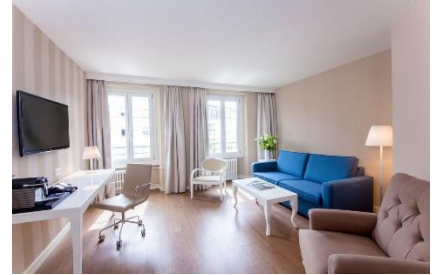
NH Genf City