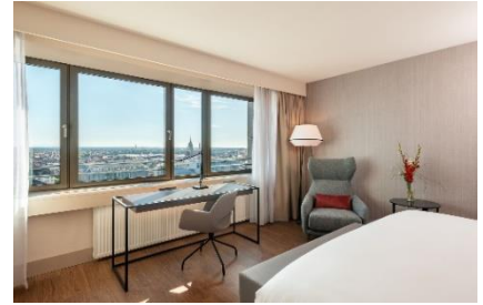
NH Collection München Bavaria