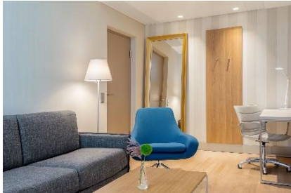
NH Graz City