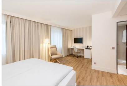
NH Düsseldorf Nord