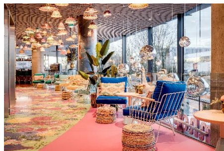
nhow Amsterdam RAI