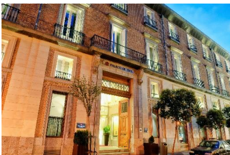
NH Collection Madrid Palacio de Tepa