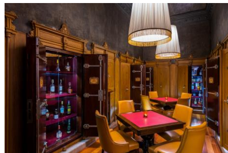
NH Collection Prague Carlo IV, Bar