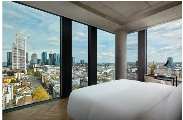
Zimmer mit Aussicht auf die Skyline Frankfurts

Aushängeschild des NH Collection Frankfurt Spin Tower ist neben der bemerkenswerten Architektur die Gastrobar Oaks at Frankfurt Spin Tower. Namensgebend sind die in Eichenfässern gereiften Spirituosen, die neben raffinierten Cocktails, Craft-Bieren sowie einer Variation von geräucherten Schinken- und Käsehäppchen in der Bar gereicht werden. Im dritten Stockwerk liegend begeistert die Oaks-Bar als schicker Treffpunkt Hotelgäste und externe Besucher. Eine Terrasse und hohe Fensterfronten bieten spektakuläre Ausblicke auf die Skyline Frankfurts.