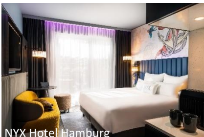
NYX Hotel Hamburg