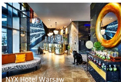
NYX Hotel Warsaw