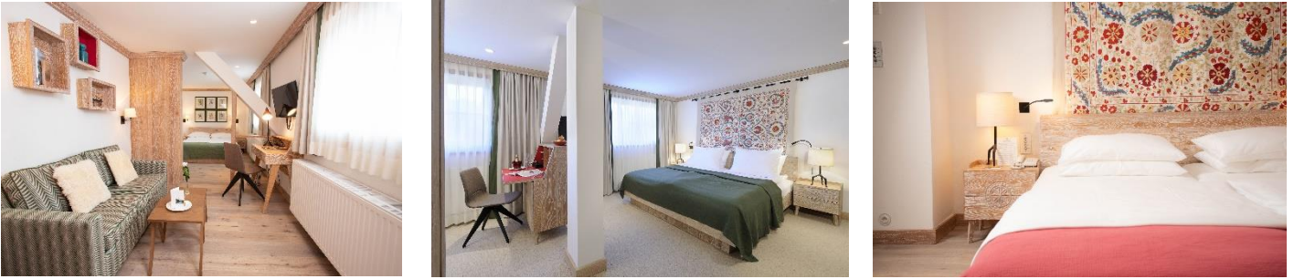
Bild 1 © Hotel Hochschober_moritzhoffmann.com, Bilder 2 © Hotel Hochschober_www.guenterstandl.de, Bild 3-4 © Hotel Hochschober