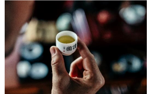
Bilder 1-7