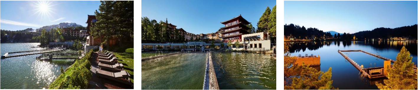
Bild 1 © Hotel Hochschober, Bilder 2-3 © Hotel Hochschober_HaukeDressler.com, Bild 4 © Hotel Hochschober_www.guenterstandl.de