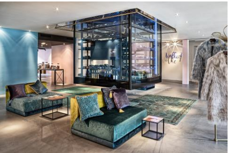
Spa Lobby mit Weinturm und Candybar