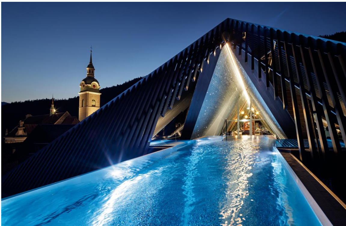
Skypool im GAMS zu zweit

Wohltuende Massagen, duftende Aufgüsse und dem Himmel so nah: Die Vorfreude auf die nächste Wellnessauszeit im GAMS zu zweit im Bregenzerwald sorgt für warme Gedanken an kalten Tagen. Das Vier-Sterne-Superior-Hotel für Paare bietet seit kurzem mit der Event-Gartensauna ein weiteres Highlight für entspannte Momente. Zwei Mal täglich treffen hier musikalische Aufgüsse auf farbenfrohe Lichtershow. Direkt gegenüber befinden sich die Onsenbecken im Stile der japanischen heißen Quellen. Bei der mystischen „Wolke 7 zu zweit“ Behandlung betreten Paare jeweils getrennt eine eigene Kabine. Beleuchtete Wege führen zum privaten Dampfbad, in dem die beiden wieder aufeinandertreffen. Danach findet die reinigende Zeremonie inklusive Ganzkörpermassage im Hammam statt. Im Anschluss geht es hoch hinaus. Gäste erhalten nur bei Buchung des Angebots exklusiven Zugang zum Rooftop. Hier befindet sich der neu geschaffene Ruhe- und Relaxbereich mit Skypool und Aussicht auf die umliegende Berglandschaft. Die Paaranwendung kostet pro Person 168 Euro. Weitere Informationen finden sich unter www.hotel-gams.at