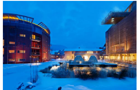
Außenansicht GAMS zu zweit