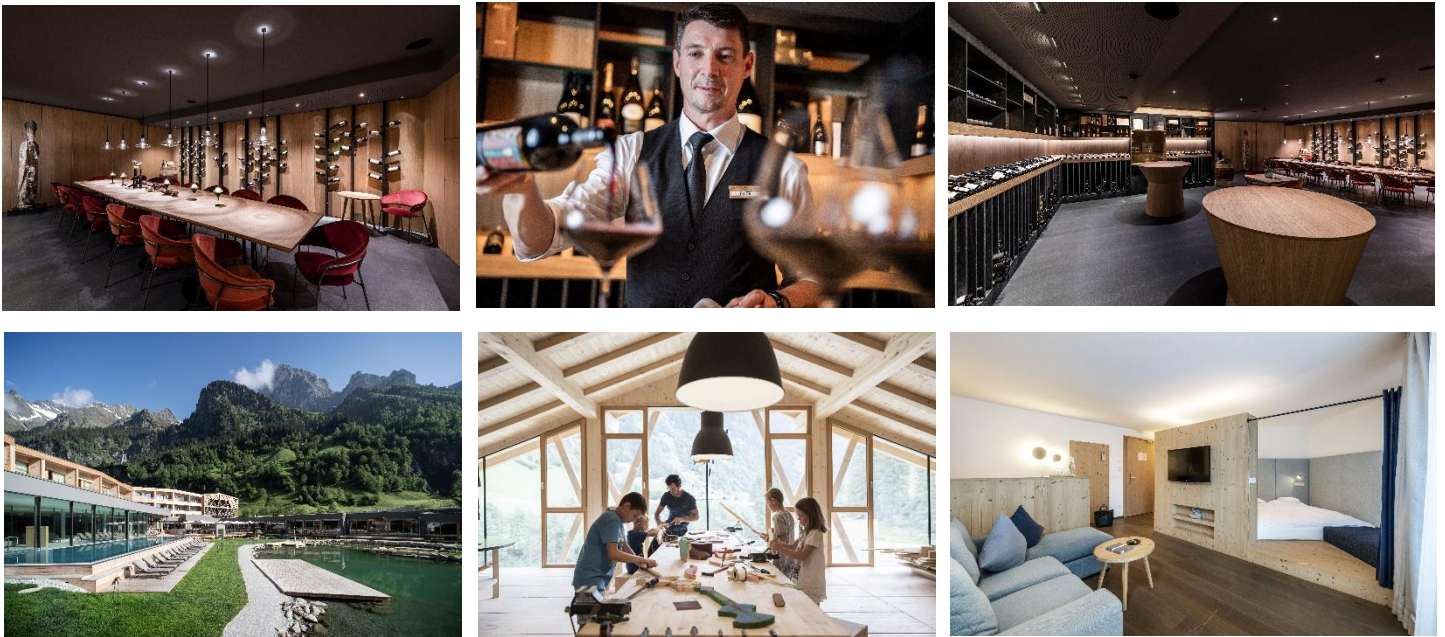
Bilder 1-7