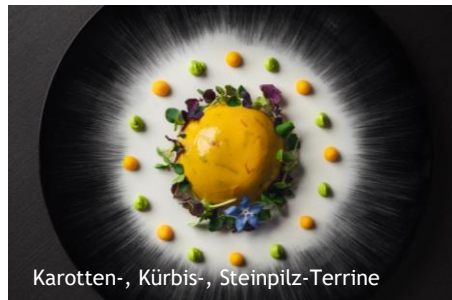
Karotten-, Kürbis-, Steinpilz-Terrine