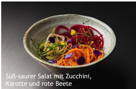
Süß-saurer Salat mit Zucchini, Karotte und rote Beete