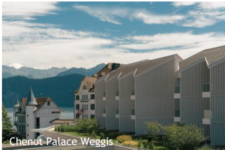
Chenot Palace Weggis