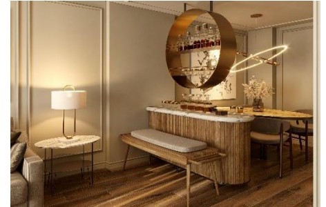
Bilder 1-7